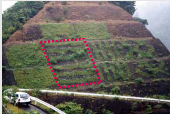
1年1ヵ月後(赤枠の部分がエコストライプ工法の標準仕様)