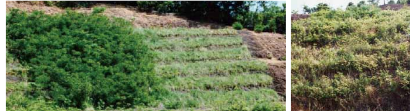
■ マメ科低木類主体の緑化事例

エコスライプ工法は、緑化領域に従来から多用されている外来草本類やマメ科低木類を導入する緑化(急速緑化)から国内産在来種(木本類・草本類)を導入する緑化(自然回復緑化)まで、幅広いバリエーションがあります。