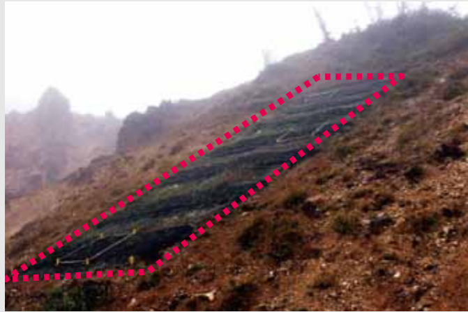
3ヵ月後(アルプラス工法仕様)