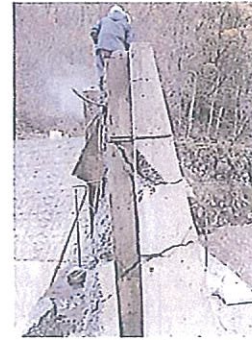
コンクリート破碎

ガンサイザー®は、財団法人土木研究センター東部の土木研究所(技術開発部)により、以下の特長を有して開発された。