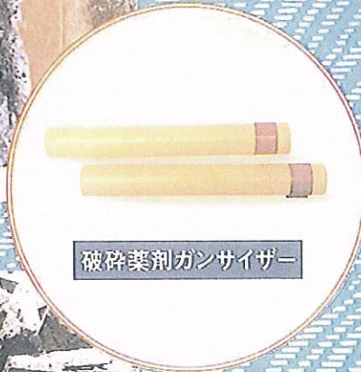
破碎薬剂ガンサイザー