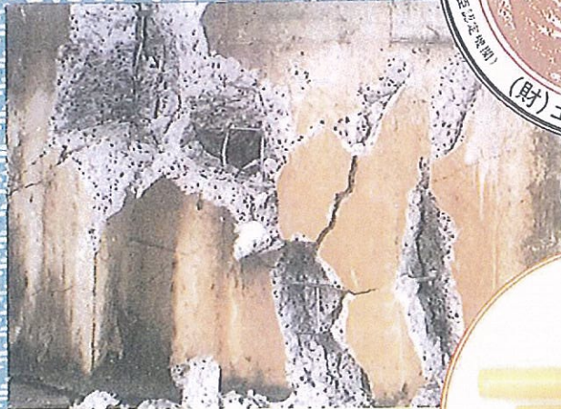
コンクリート破碎